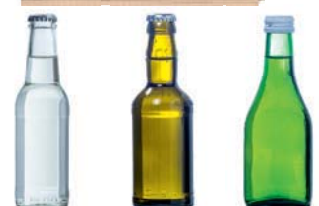
Verwendbar zum Beispiel für 0,2l Flaschen mit ca. Ø 35 mm oder ca. Ø 44 mm, Höhe ca. 175 mm