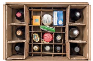
6er- STEHBOX PREMIUM/KOMPAKT® Karton