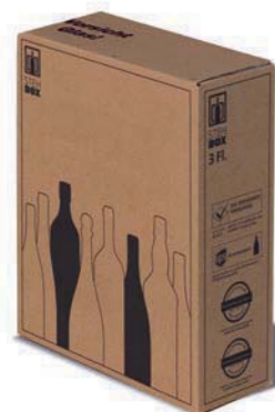
3er STEHBX® mit PREMIUM Einlage

Wichtig! Zur richtigen Verklebung der Kartons beachten Sie bitte den Hinweis im roten Kasten auf nächster Seite.