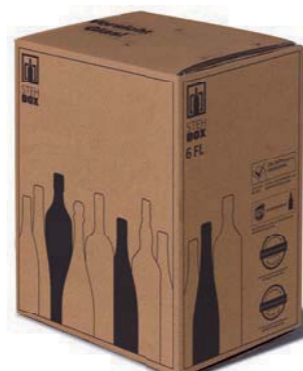
6er STEHBX® mit PREMIUM Einlage