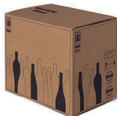
12er STEHBX® mit PREMIUM Einlage