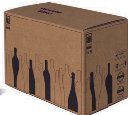
15er STEHBX® mit PREMIUM Einlage