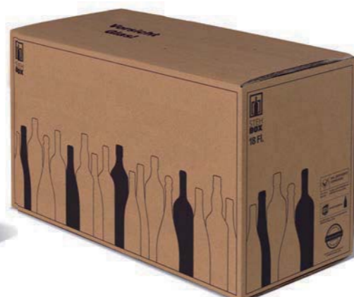
18er STEHBX® mit PREMIUM Einlage