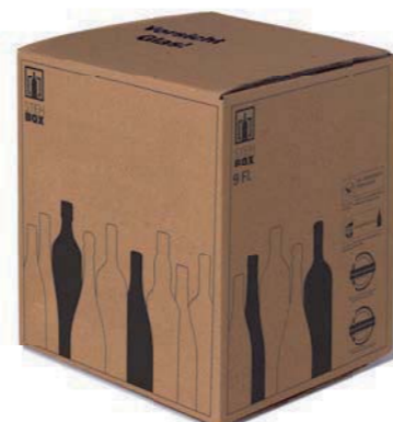
9er STEHBX® mit PREMIUM Einlage