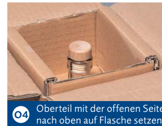
O4 Oberteil mit der offenen Seite nach oben auf Flasche setzen.

! Einlagen generell zuerst in den Karton stellen und dann mit Flaschen befüllen.