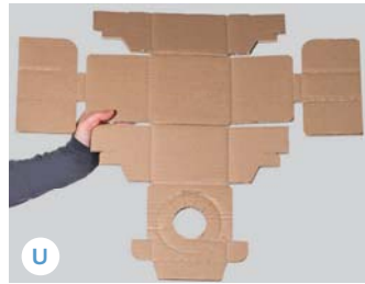
U1 Innere Klappen ineinander verhaken